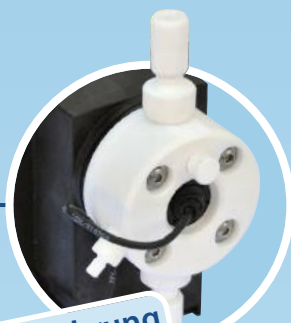
Ausführung R033 - FC