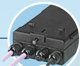
Ritmo 033 E-Box

Zur Fernsteuerung aller Einstellparameter sowie Fernüberwachung aller eingestellten Werte und erfasster Fehlerursachen.